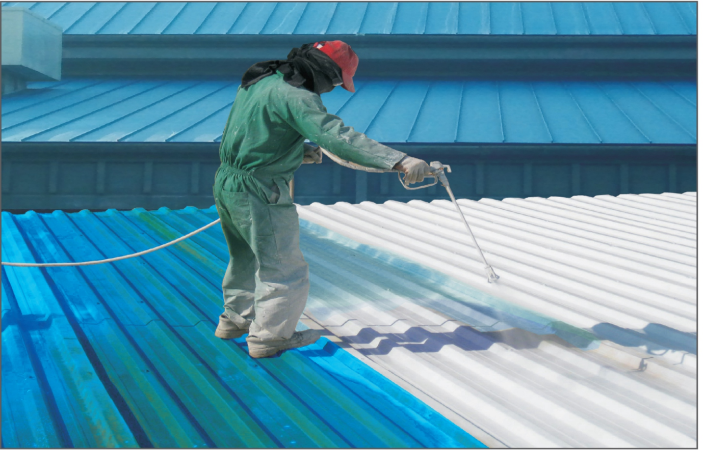
Wet Area Water Proofing